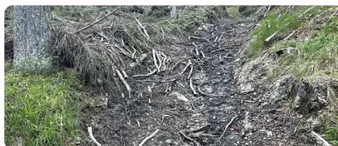
Wanderweg nach Unwetter