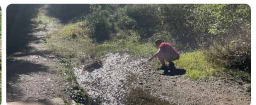
Bruno im Bergbach